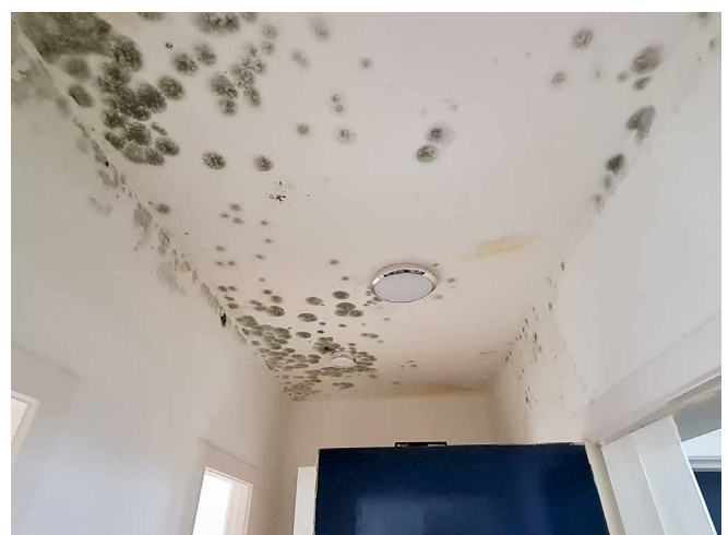
Abb. 2: Massiver mikrobieller Befall an der Decke und den Wänden im OG