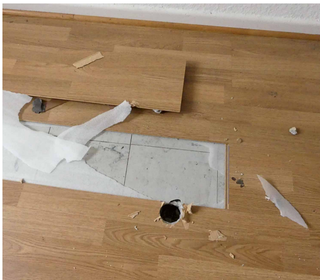
Abb. 3: Öffnung Fußbodenaufbau in Wohnung OG

Als die Eigentümer abends nach Hause kamen, strömte ihnen Wasser im Treppenhaus entgegen. Als Schadenstelle wurde daraufhin die Warmwasseraufbereitungsanlage im Dachboden des mehrstöckigen Wohngebäudes lokalisiert. Mit Hilfe eines hinzugerufenen Sanitärbetriebs sowie der Feuerwehr konnte der Wasseraustritt gestoppt und stehendes Wasser innerhalb des Gebäudes aufgenommen werden. In den Tagen darauf wurde die defekte Warmwasseraufbereitungsanlage durch eine neue ersetzt und mit Schadenbeseitigungsmaßnahmen (z. B. Verräumen des betroffenen Hausrats, Ausbau des aufgequollenen Parkettbodens) begonnen. Das Parkett war mit einem schwarzen Kleber befestigt, der Estrich war ebenfalls schwarz. Die ersten Abbruchmaßnahmen erfolgten durch eine Firma für Schimmelsanierung bei geöffnetem Fenster. Bei der nachfolgenden Scha-