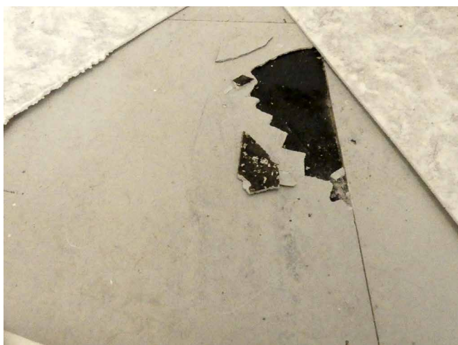
Abb. 4: Asbesthaltige Bodenbelagsplatten samt schwarzem Kleber