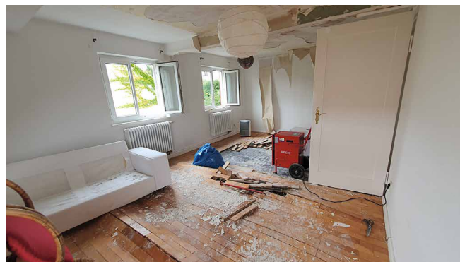
Abb. 5: Wohnraum OG unterhalb Schadensort im DG